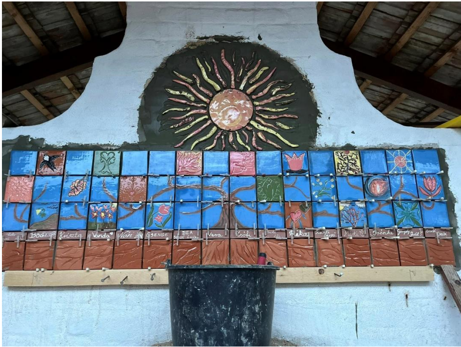
Csempék immáron a helyükön